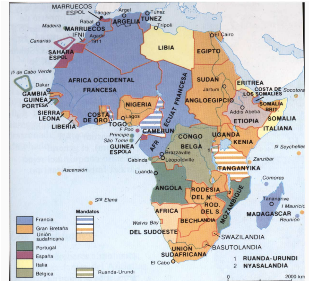
Tomado de: https://iesdrfdezsantana.educarex.es/web/departamentos/ccss/1Bachill/Colonialismo.pdf

Rápidamente, todos los países europeos se apresuraron a “invadir” África, tratando de apoderarse del máximo pedazo posible del continente. En pocos años la situación fue la siguiente: